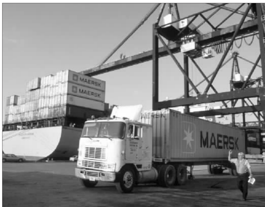
美元疲软推动美国去年 11 月份的出口总额创下历史新高 资料图

美国总统布什今年初曾表示, 计划到 2012 年使美国联邦政府财政预算达到平衡, 不过, 如果不有效控制包括军费在内的开支, 要实现这样的目标恐怕并不容易。