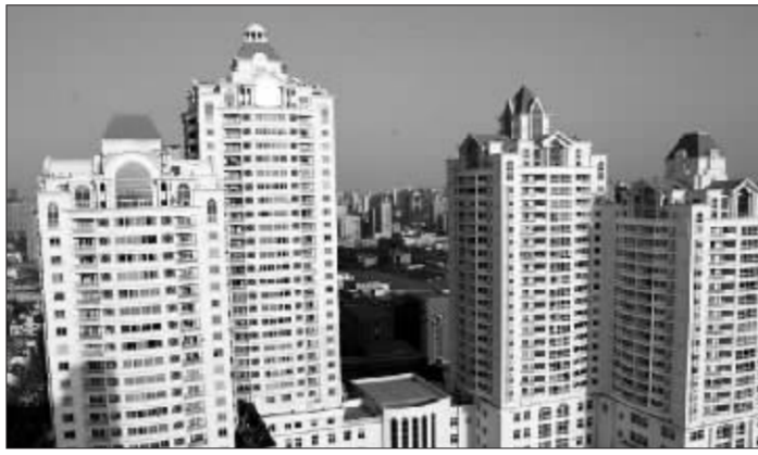
明园在上海开发的第一个大型楼盘“明园世纪城”资料图

程,撤销李松坚政协第十屆上海市委员会委员资格。” 或与阳光保障计划有关 涉嫌被挪用资金的来源,目前尚无官方说法。上海电气董事会秘书昨日向记者强调,李松坚涉嫌挪用的“公款”不是上市公司的钱。而上海电气集团总公司党群工作部部长孙德意则称,“不了解相关情况”。记者就此多次致电上海电气集团总公司纪委书记金红军,但未能接通。有关内部人士则表示,此事可能由上海电气母公司上海电气集团总公司直接负责。一位接近上海电气的人士称,此事或与上海电气集团总公司的“阳光保障计划”有关。公开资料显示,“阳光保障计划”主要由韩国璋负责,该项计划是上海电气集团总公司内部担保,用于帮困保险和扶贫救助。此前韩国璋“事发”,也被猜测与之相关。该保障计划服务手册显示,投保对象主要是“托管托养中的协保、内退、丧劳人员”。不过,根据韩国璋去年1月在有关会议上的介绍,上海电气集团总公司为之每年拨款1000万元。而该计划于2004年开始实施,至今不过三年多。