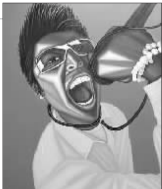
罗丹《摇滚浪潮系列》

八零年代, 不可泯灭的就是“张扬”, 他们的字典似乎不完全, 少了“谨慎”“忌讳”之类保守派的字眼儿。不管你看不看得惯, 八零年代就是八零年代, 不会特意看别人的脸色行事。八零年代在横溢的才华之外, 有着自己的个性, 有着桀骜不驯的本质, 正活力十足, 大有“一万年太久, 只争朝夕”的豪气。