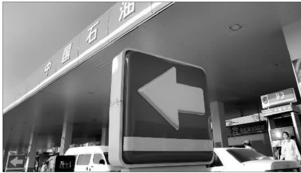
2006年,中国石油加油站总数达到18207座

不过,孝峰指出,值得注意的是中石油原油产量于过去连续两个季度出现下跌的情况。2006年第三季,公司原油产量为2.07亿桶,第四季度为2.036