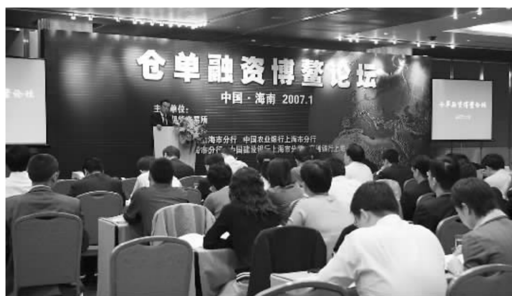
仓单融资博鳌论坛现场 资料图

为探索并推动仓单融资在国内的发展,服务于相关企业,促进银行等金融机构通过期货市场进行业务创新和风险管理,上海期货交易所联合五家指定结算银行于1月12日在海南召开了“仓单融资博鳌论坛”。参加论坛的相关人士反映,上期所打造期货仓单管理中心、研究探索仓单融资业务的国内外发展概况,是落实“主打创新服务”工作目标的的具体实践。这不仅对我国期货市场的建设和发展产生积极影响,同时也将满足企业发展与银行创新的现实要求,为商业银行的业务发展提供了新的舞台。