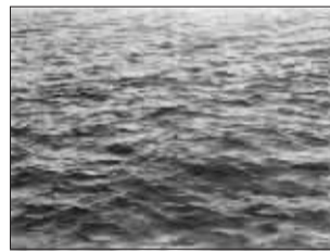
图6 展览城市：美国 展览地点：翰墨博物馆 展览时间：2007.1.28-2007.4.22

来自拉托维亚的威亚·塞尔敏 Vija Celmins 在长年工作生活于美国，乃至声名鹊起成为战后一代最具影响力的艺术家时，往往被报导为美国生人。当然，女艺术家凭借她大容量的知觉记忆，仅用软铅笔把海浪、云线、蛛网、月晕或夜空画得如卫星射电照般纤微毕至时，其自然派的神秘主义确实让人想起坡的恐怖传统，其童趣也确如北美遍地的 low-fi 乐队灰暗清幽的音色一般，画家经常玩弄的空间悖论更是让人想起在美国备受推崇的埃舍尔，以及连带着的菲利普·格拉斯和霍夫斯塔德。