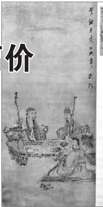
陈洪绶《高士赏砚图》

其它名家如黄宾虹的《山水》以 88 万元成交,陆俨少的《山水》以 81.4 万元成交,曾宓的《山水清音》以 61.6 万元成交。