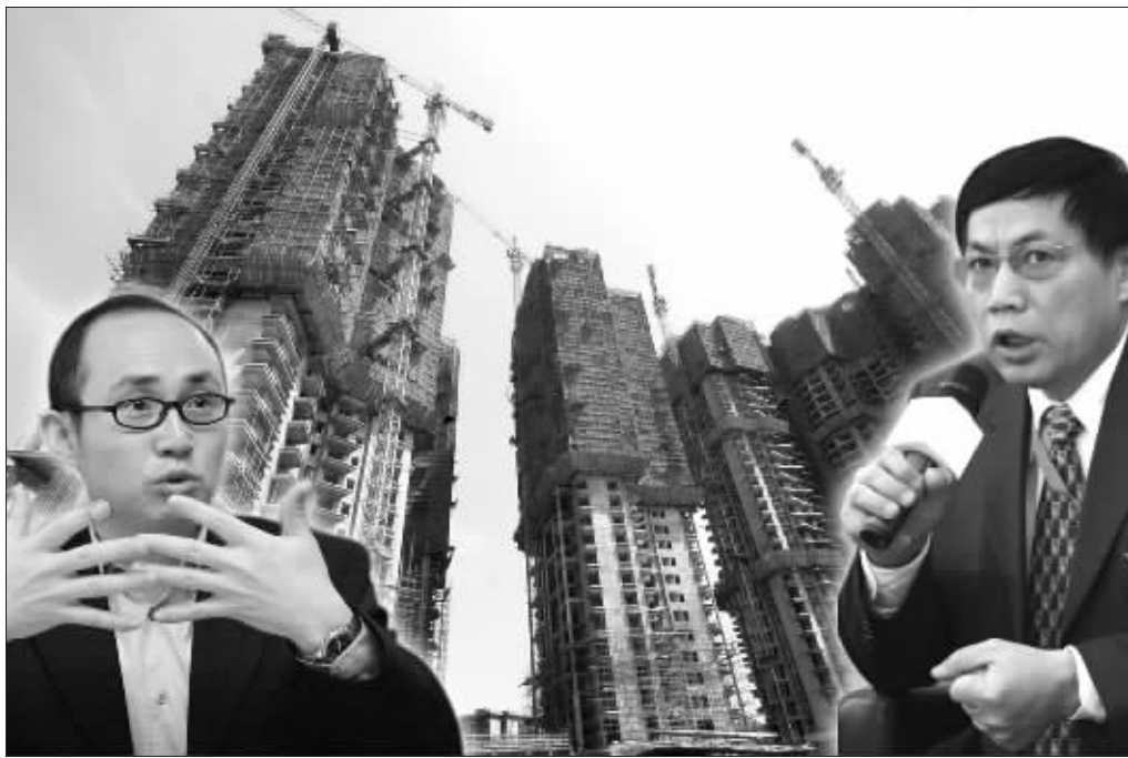
京城地产名人任志强(右)、潘石屹(左)分别在个人博客上发表文章,评价政策影响 郭晨凯制图

此前,有媒体报道,上海一些大型房地产开发商已经秘密碰头,准备联手向市领导上书,希望在土地增值税征收的地方细则制定时考虑一下企业的生存问题。据业内人士估计,如严格征收,2004至2006年,上海每年的土地增值税至少能征收400亿元左右,其中利润率高的囤地较多的企业或将受到致命的打击。