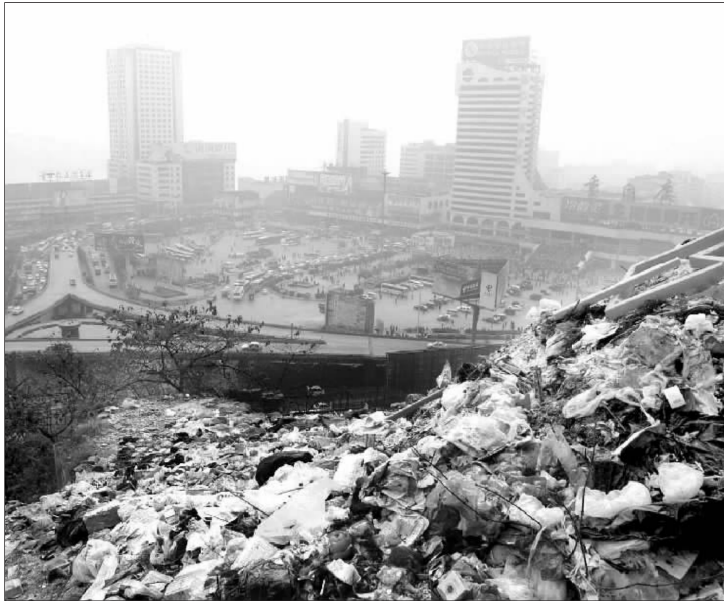
城市周围的“垃圾山” 资料图