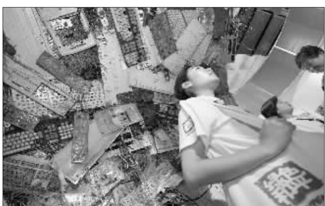
废旧电脑配件,电子垃圾污染成灾 资料图

岳毅桦说:“如果说真正承担责任的话,绝对是把这批洋垃圾出口到中国来的那个公司,那个发达国家必须承担他们的责任,他们应该运回去。这也是有先例的,只要在海关发现或截获这样的垃圾,必须全部退回。”