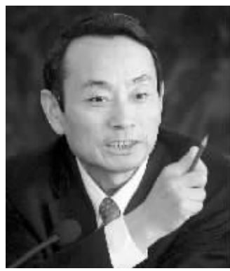
中石油总经理蒋洁敏