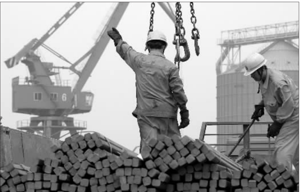
今年国内新增粗钢产量将主要在国内外消化 资料图

罗冰生认为,今年国内粗钢消费增幅预计在10%左右,将在去年增幅13%的情况下,回落3个百分点,仍属适度增长,国内对粗钢的需求总体旺盛。主要的问题将表现在进出口对行业运行和供需关系的影响上。如果今年国内粗钢出口数量仍总体保持去年的水平,按产量增长10%计算,今年国内粗钢产量将为4.62亿吨,同比增量4200万吨。如考虑将2006年被消化的1400万吨库存在今年给予补充,那么粗钢产量将达到4.75亿吨,同比增量5500万吨,同比增长13%。也就是说,