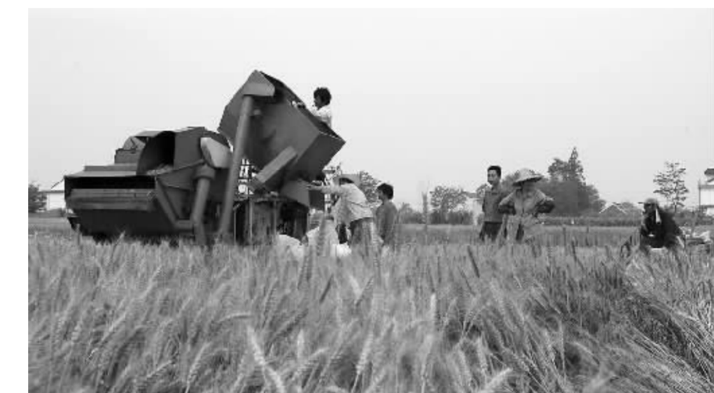
农业部表示,“十一五”期末,各类专业合作社组织吸纳农户数量力争达到30% 资料图

郑风田说,此前我国对产业化的基本共识是农工商或贸工农一体化经营,政策的中心也一直是培育龙头企业,采取“公司+农户”的形式。虽然这种模式确实是在农村经济发展中显示出了前所未有的力量,但这种以企业为主导的农业产业化经营模式,在中国的现实国情下面临一系列问题。“只在单一链条上修补和延伸,缺乏整体统筹和协调的考虑。”郑风田表示。