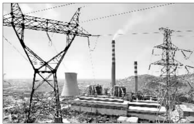
新的调度方式将抑制能耗高、污染重的机组发电 资料图

发改委前天公布了《关于加快关停小火电机组若干意见的通知》。《通知》称,优先调度可再生能源和高效、清洁的机组发电,限制能耗高、污染重的机组发电;未实施节能发电调度的地区要实行差别电量计划,鼓励可再生能源和高效、清洁大机组多发电,并逐年减少未关停小火电机组的发电量。国家发改委正在制定节能