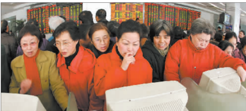
投资者入市热情高涨,成交量创出历史新高 徐汇资料图