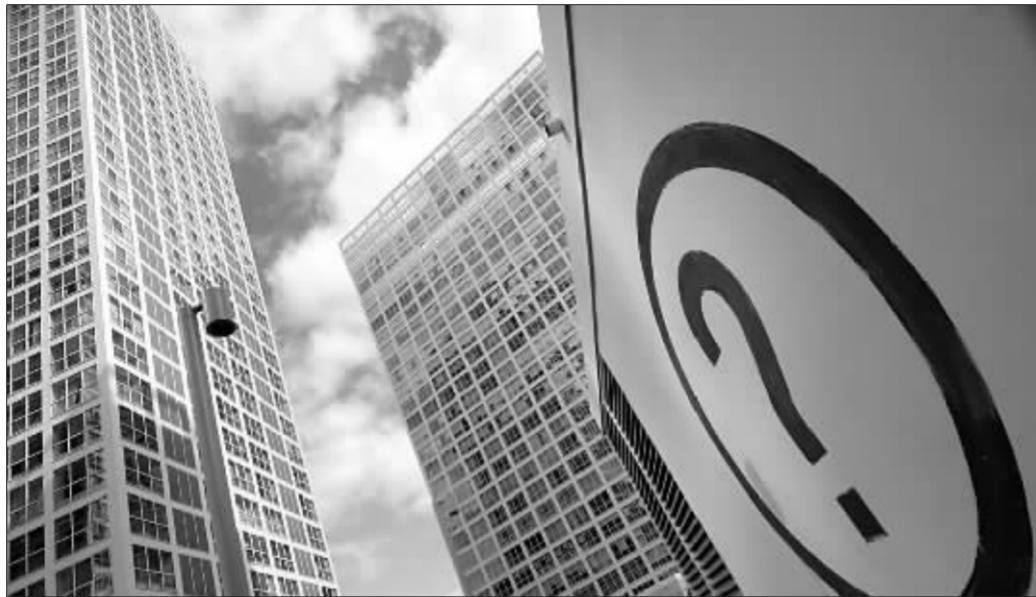
调控当头,房地产业前景不明 资料图

1月25日,国税总局公布《关于房地产开发企业土地增值税清算管理有关问题的通知》(下称《通知》),要求房地产开发项目在销售结算时严格按照超率累进税率,征收开发利润30%至60%不等的土地增值税。政策一出,房地产开发界一片哗然。“此前虽有清算风声,但没有想到政策来的这么快,且相当严格。”上海某房地产开发商在政策出台后曾向记者表示。在房地产股短期暴跌后,开发商进入了对策研究期,“毛坯转