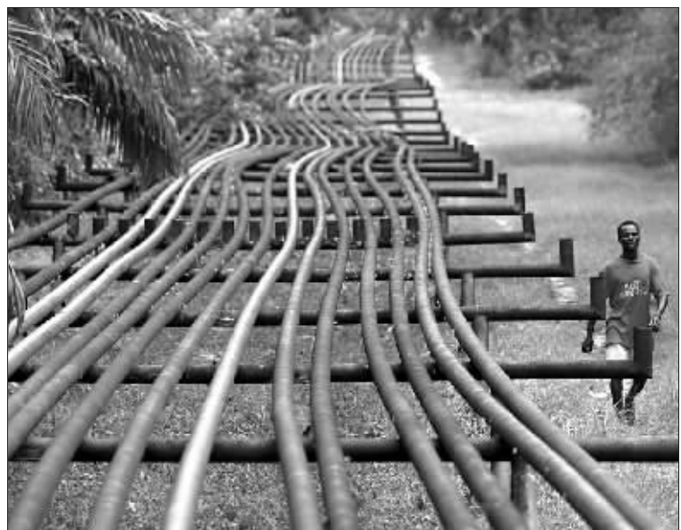
尼日利亚石油管道 资料图