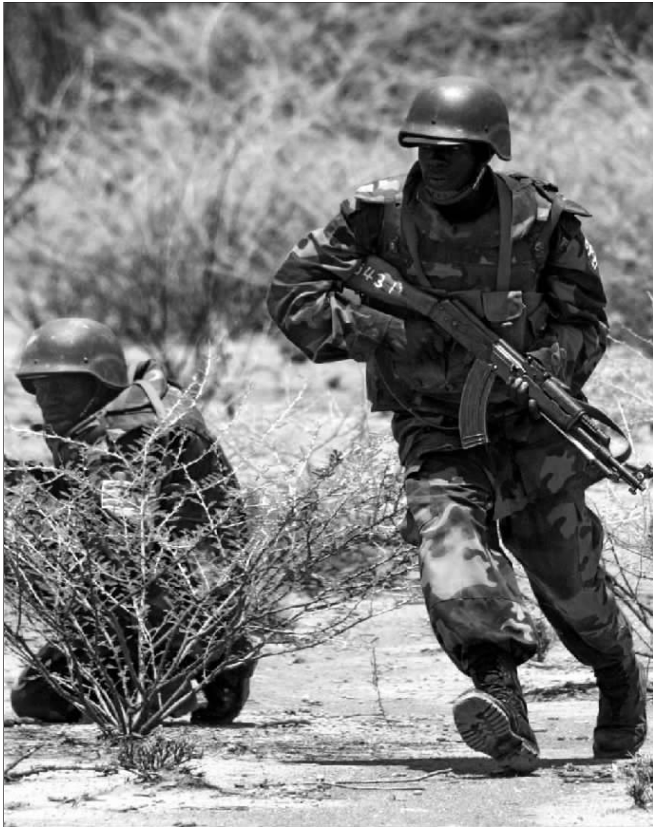
美军在肯尼亚军演 资料图

今年1月,美国两次向索马里派出战机,空袭处于溃退状态的索马里教派武装。美国说,上述3名“基地”成员藏身在教派武装之中。