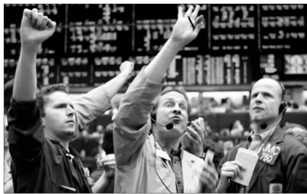
伦敦铜价大涨带动了沪铜涨停 资料图

面对国际基金现阶段如此纷繁复杂的操作,国内的分析师表示,从近几日内期铜市场的持仓情况来看,国内的空头持有者考虑到长假期间国际市场的不确定性,认为国际铜价可能会继续上涨,因此纷纷选择平仓离场,沪铜的涨势大部分来源于空头的平仓动能。上海中期研究部经理蔡浩益介绍,近几日有大量沪铜空头头寸离场。从盘面的持仓来看,在