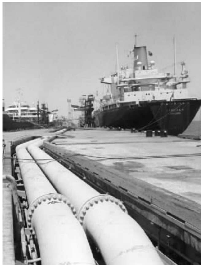
沙特石油输出 资料图