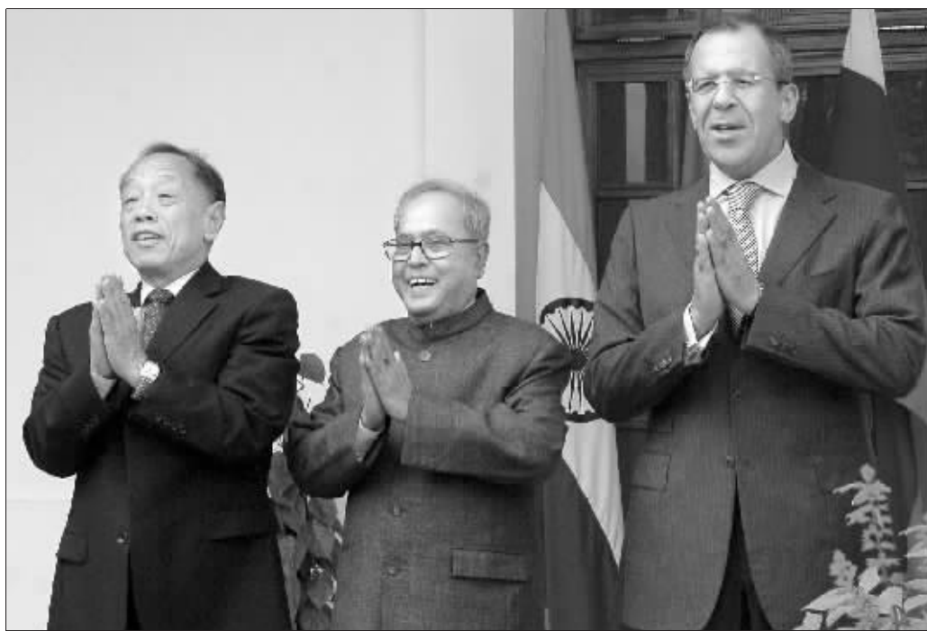
中国外交部长李肇星、印度外长慕克吉和俄罗斯外长拉夫罗夫(从左到右)会晤

13日的中印外长会谈中,李肇星表示,中印经贸合作发展迅速。双方在能源、科技、文化和