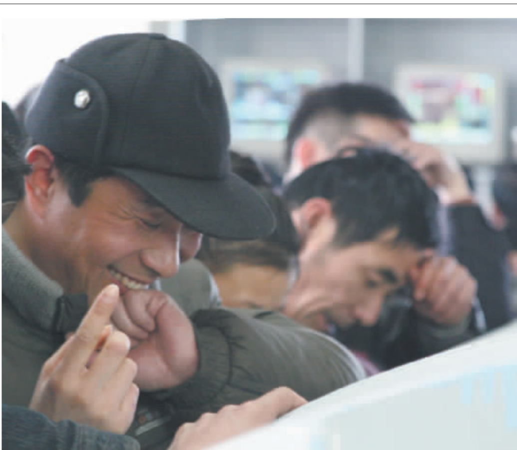
2月14日,安徽阜阳一证券营业部内的一位股民露出喜悦的笑容。