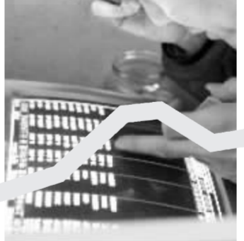
新春首日股民喜获“红包” 本报记者 徐汇报

与此同时，在国信证券深圳红岭中路、中投证券深圳深南中路、长城证券深圳东园路等多个营业部，同样的繁忙景象也在上演，股民如潮水般拥入，庞大的财富管理需求彰显无遗。