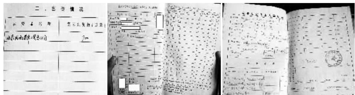
荣华工贸出资焙糖厂证明