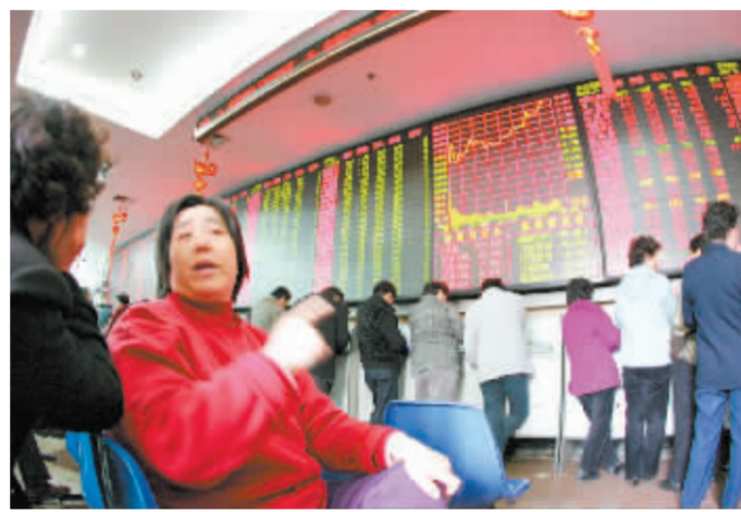
昨日两市个股全面反弹

从 2 月份的行情特点来看,市场机构投资者的分歧表现得非常突出。继 1 月份股指连续五周剧烈震荡之后,2 月份行情先抑后扬,在跌破沪指 2600 点平台下轨之后出现报复性稳步反弹,而本周大盘又在突破沪指 3000 点平台后出现恐慌性大跌。从月线看,上证综指和深证成指 2 月份涨幅分别为 3.4% 和 5.33%, 远低于前三个月的涨幅,同时月 K 线上下留下了较长的上下影线,表明多空双方搏杀激烈,最终多方仍取得了一定的优势。