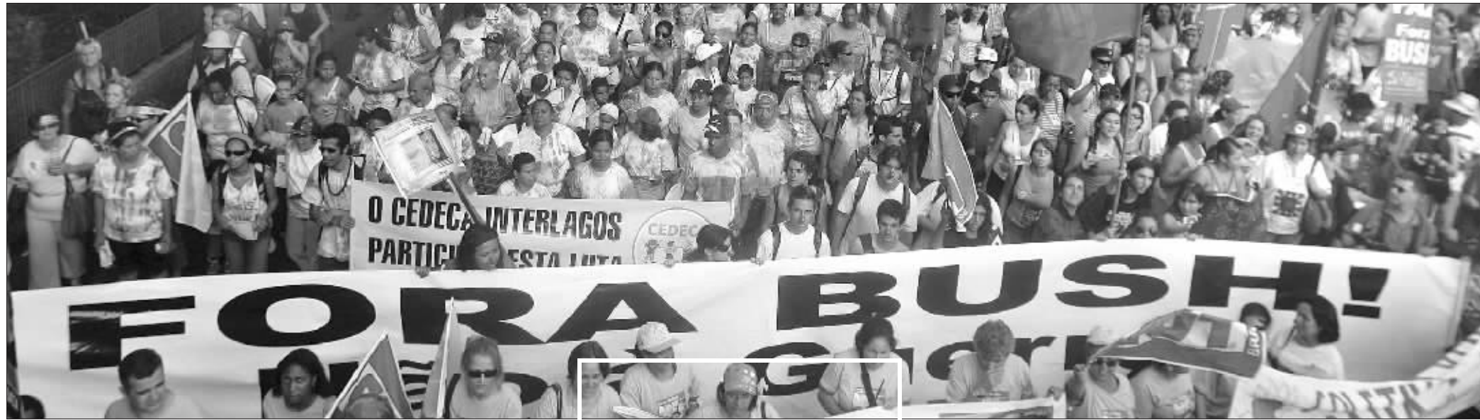
巴西民众抗议布什来访

美国总统布什8日开始对巴西、乌拉圭、哥伦比亚、危地马拉和墨西哥访问。有消息称,布什此次拉美五国行的目的是重新拉近美国与拉美国家的关系,改善美国在拉美的形象,遏制死对头委内瑞拉总统查韦斯日益扩大的影响。但分析人士认为,布什此行除了政治目的外,更大的目的在于经济利益。此次拉美五国行,让布什不解的是,出访前他曾表示此行是增大对拉美的援助,应该受到礼遇,但事与愿违,布什所到之处都遭遇抗议,甚至演变成暴力活动;让布什更为难堪的是,查韦斯在乌拉圭的邻国阿根廷主持了声势浩大的反美集会,公开叫板。而对于造成这一切的原因,分析人士认为,完全是由于布什及其政策,尤其是发动伊拉克战争,受到了拉美国家的普遍反对。