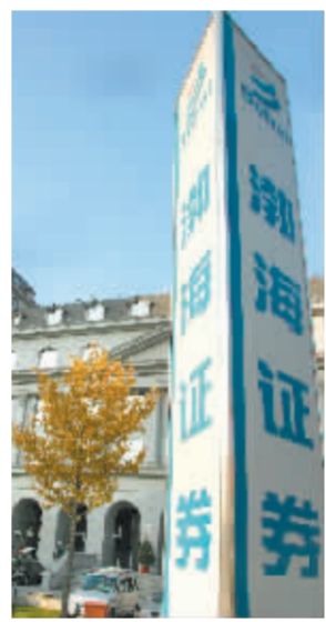
渤海证券正申请规范类券商

除了四环药业,市场近期还流传渤海证券将借壳青海明胶。针对此传言,泰达控股及泰达股份均确认不存在渤海证券借壳青海明胶的可能。泰达控股及泰达股份直接和间接持有渤海证券的股权达到54.33%。青海明胶也表示,不存在“渤海证券借壳上市的最佳选择”的可能性。