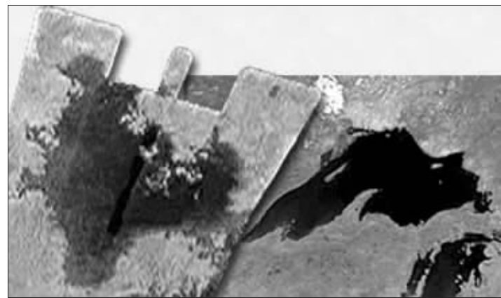
土卫六局部的合成图片

专家表示,面对这种情况,增加储蓄可能是一种应对手段,但这是一种比较消极的方法,会导致内需不足,更积极的策略应该是通过提高人口知识水平。华教授表示,要解决老龄化给经济带来的困扰,有三个建议:一是人口政策调整,但现在看来这方面空间不大;第二,鼓励人口流动,特别是年轻人;第三,增加人力资本投资,推迟退休年龄,这也是最为积极有效的一种方法。