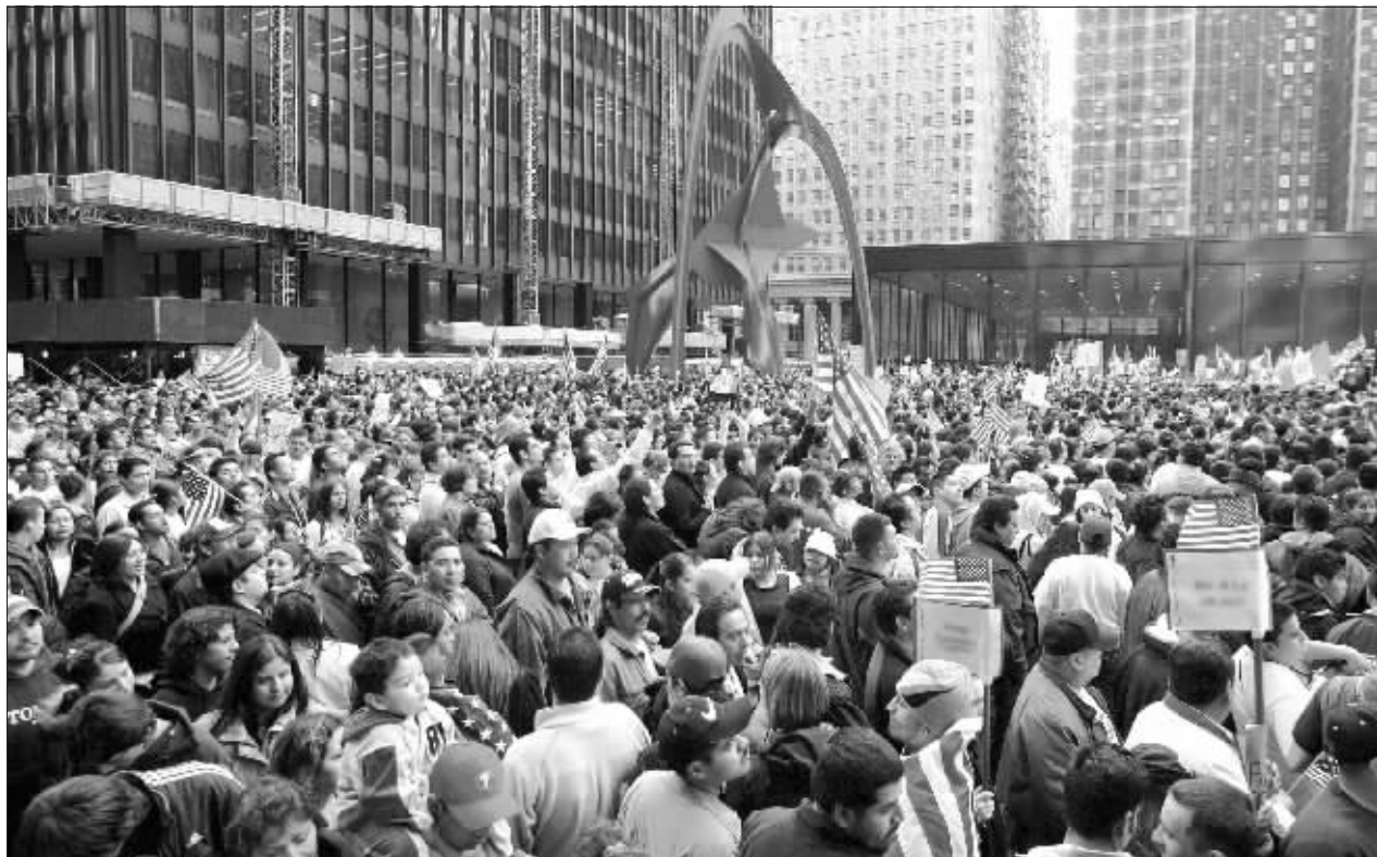
急剧增长的全球人口成了人类共同关注的课题 资料图

报告说,今后43年,如果人口实际出生率略高于人口司估计值,世界人口2050年将达到108亿,如果实际值比估计值略低,世界人口届时将为78亿。