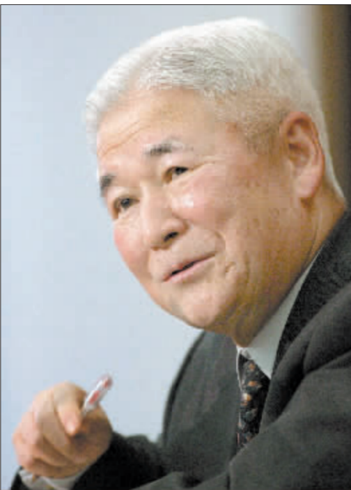
伯南克(左)与福井俊彦各有各的难 资料图

商务部研究员梅新育博士表示,他认为,美联储现在面临进退两难的境地。当地时间20日和21日,美联储将迎来今年的第二次货币政策例会。