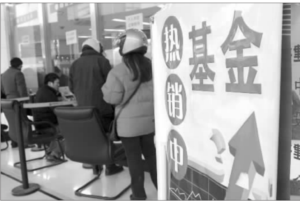
今年以来基金销售十分火爆 资料图

根据基金合同规定,开放式基金结束募集后会进入一个不超过3个月的封闭期,期间,该基金不能申购也不能赎回。