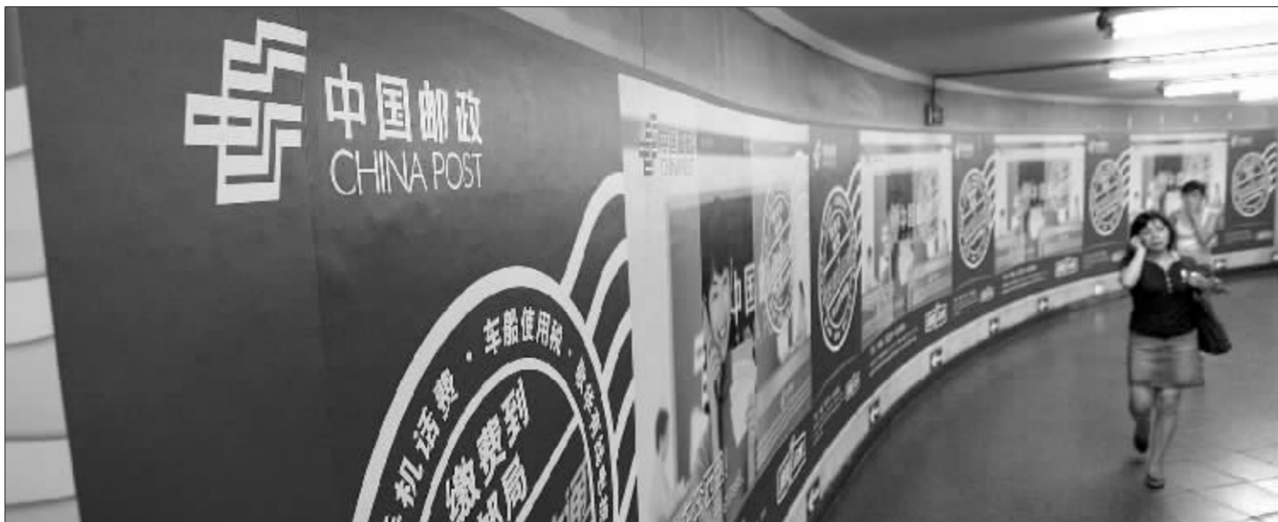
中国邮政的改革一直低调而稳步地推进 资料图

事实上,为了打造核心竞争力,中国邮政早就有意将旗下酒店脱手。去年9月,国家邮政局主辅分离改革办公室负责人曾对上海证券报透露,中国邮政有意出让旗下数百家酒店,已有多家国内外企业前来洽谈过,希望能够