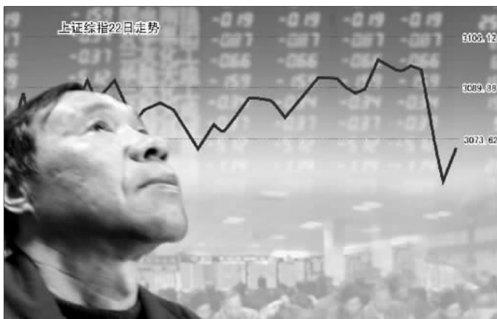
昨日尾盘放量回挫并弥补大半跳空缺口透露出市场心态的微妙变化 郭晨凯制图

盘面显示，现阶段蓝筹股阵营走势回暖过程中，保持了适度轮动的格局。在中国石化放量大涨的带动下，石化板块涨幅昨天稳居首位；化纤、运输物流、电力、钢铁等板块同样不改前期强势。而前期逼空的低价题材股则普遍走势偏弱。下午沪指在中国石化的强