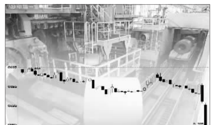
包钢认沽权证走势 郭晨凯制图

97.92%,换手率高达1405.77%,全日成交117.23亿份。事实上,包钢认沽权证的内在价值早已为零。