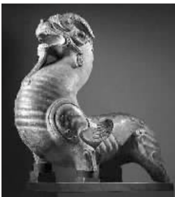
六朝时期大型石灰石神兽雕刻