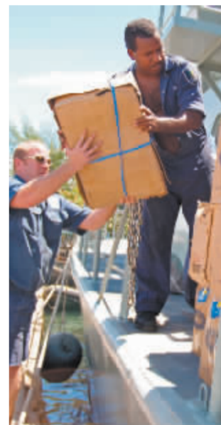
灾后救援 本报传真图