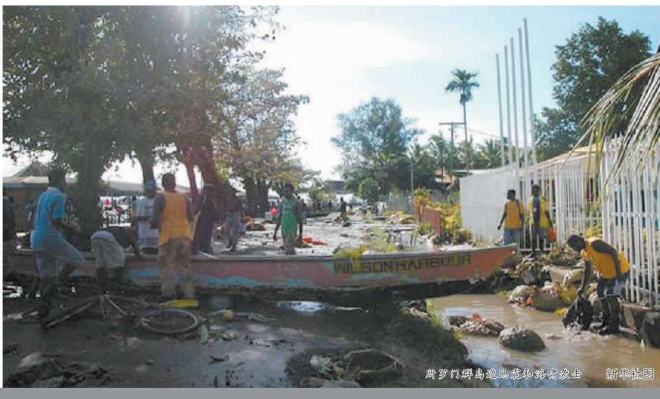
所罗门群岛遭地震中海啸袭击

中国外交部2日发布消息,提醒在澳大利亚中国公民和即将赴澳的人士要注意跟踪最新海啸预警信息,采取预防和避让措施,遇紧急情况及时与我驻澳使领馆联系。