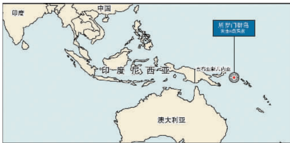
所罗门群岛大地震示意图 张大伟制图

专家表示,所罗门群岛地处太平洋火山带,长期以来当地的火山活动和地震都相当频繁,并曾数次发生过地震,因此发生这一强烈地震并不令人感到惊异。(冯俊扬 成汉平 张竞文)