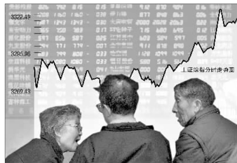
上证指数首次攻克 3300 点 张大伟制图