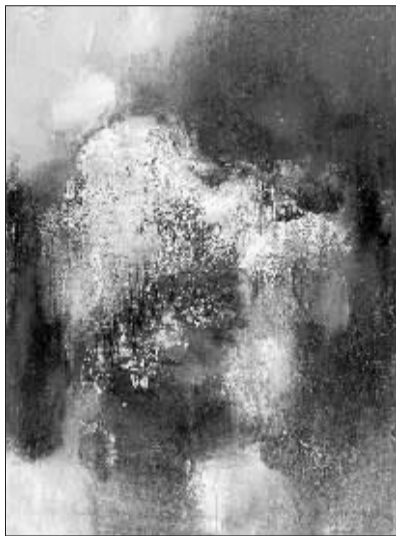
王衍成作于2005年的《山水之间》

俸正泉作于2005年的《山水》,有山水的名头,有山水的形象,甚至有花鸟的造型。只是平涂的大片运用,无色的背景环境中穿插的现代人与物,总有些不伦不类的滑稽效果,不免让人五味杂陈。