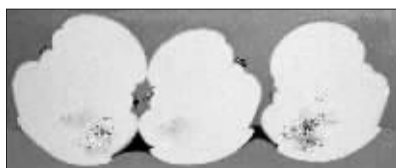
李明铸的《中国·大瓷·山水篇》