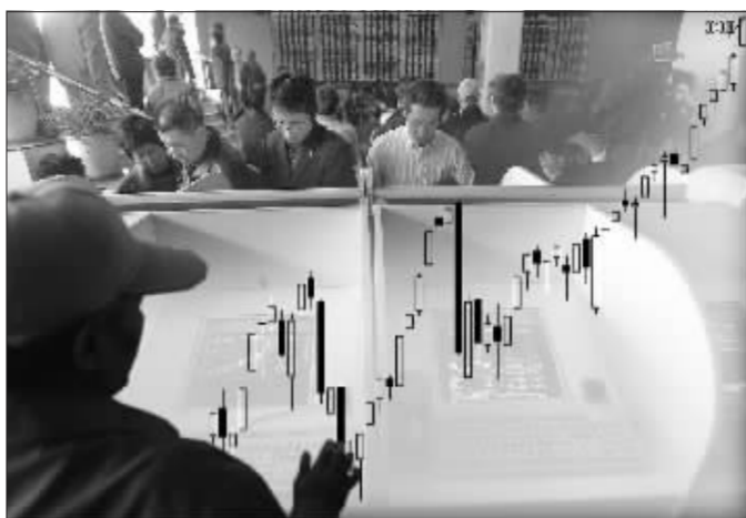
沪深 300 指数顺利突破 3000 点