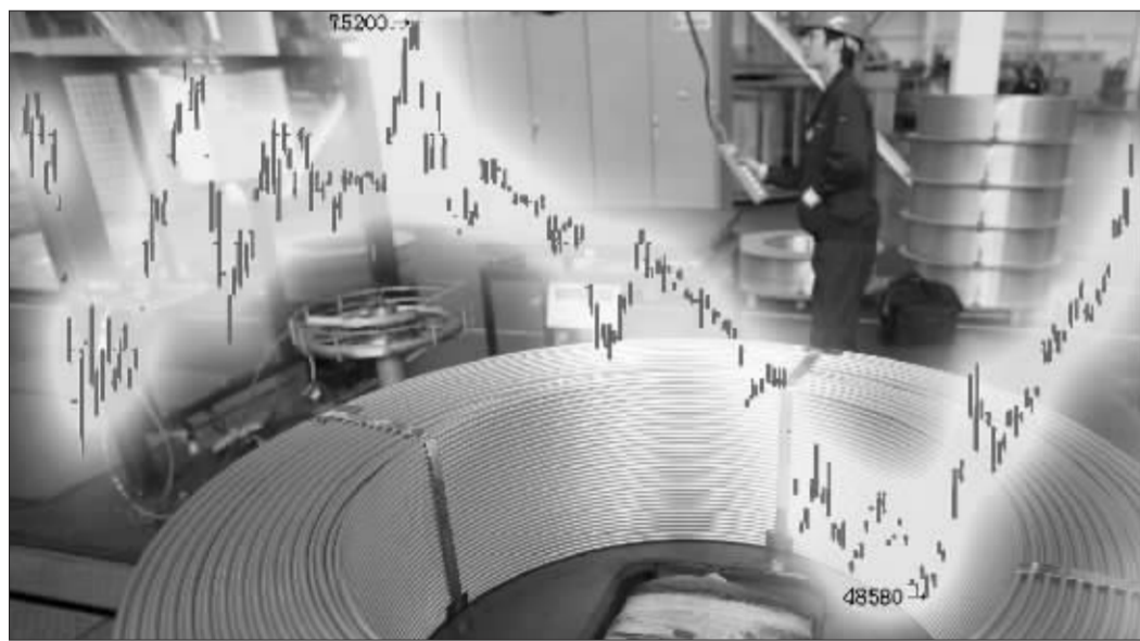
沪铜近两日快速拉升 张大伟制图