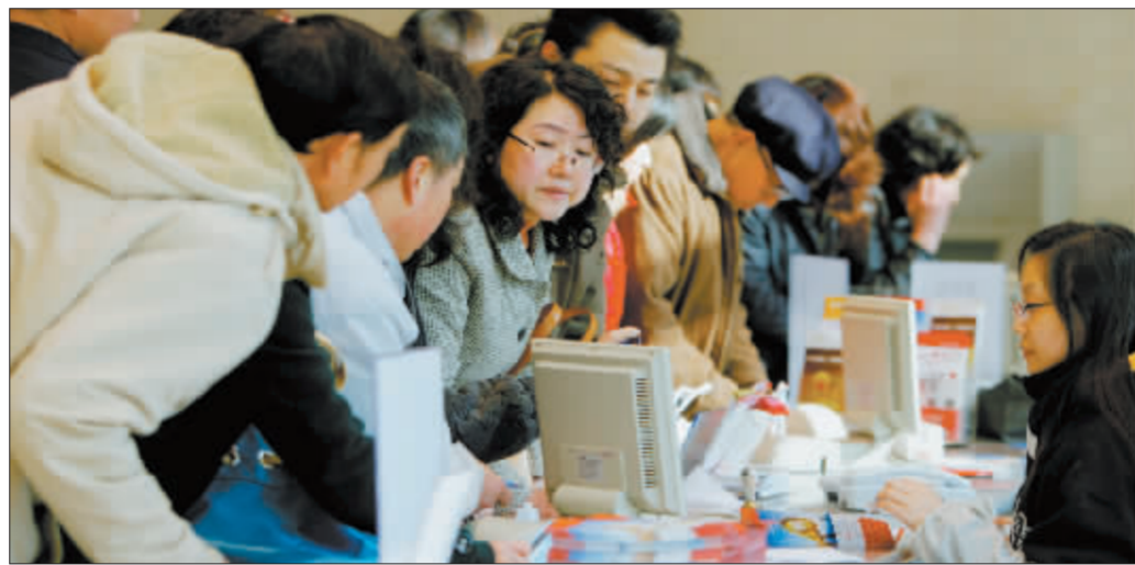
投资者偏好新基金 资料图

识后,选择了赎回。”该人士说。资金“大进大出”、“快进快出”的不良后果已经开始反映在基金的业绩上。来自晨星公司的数据显示,今年一季度,在183只国内股票型基金中,仅有9只基金跑赢了沪深300指数。一些基金经理在接受记者采访时也表示,频繁、大量的赎回使得他们的操作难度大大增加,从而影响了基金的业绩。基金经理告诉记者,基金持有人往往在 market 下跌过程中