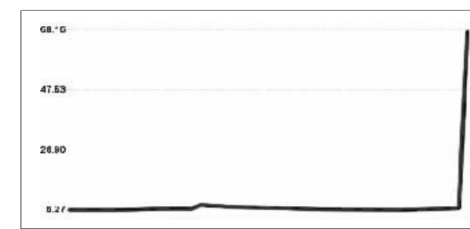
*ST长控走势图 其股价昨日垂直上升 郭晨凯制图

昨日*ST长控和*ST一投均是跳空高开。*ST长控开盘价为14.36元,两分钟后就被推高到40元,之后一路飙升,11点左右股价达到了惊人的85元,后虽有下降,但早盘收盘还是达到68.16元。比复牌前上涨了849.3%,复权后涨幅达到1083%,换手率76%。*ST一投开盘价为8.5元,最高曾一路