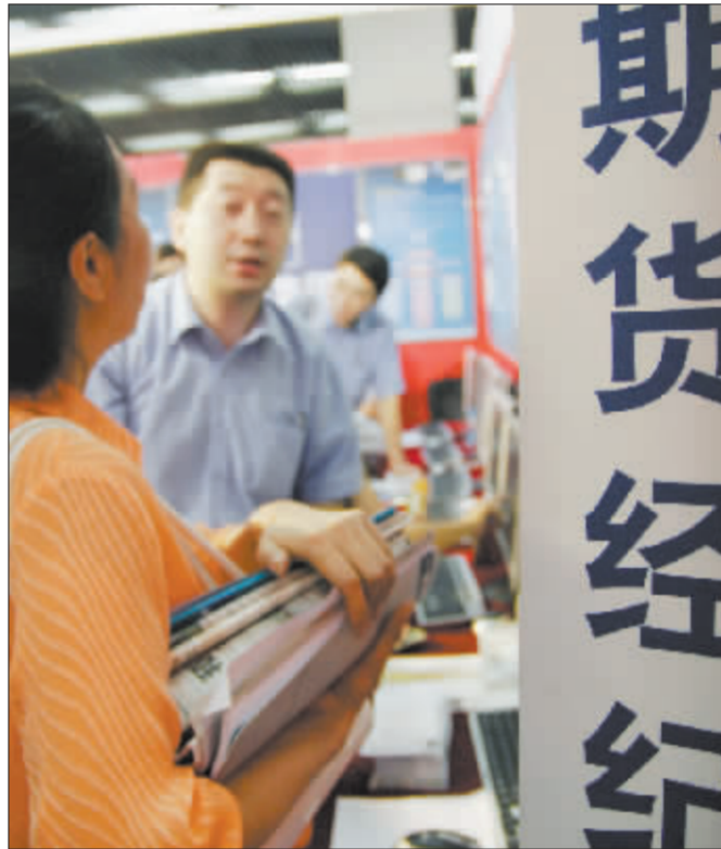
价格战是造成期货业生存窘境的主要原因之一 资料图

不正当竞争长期存在使得整个商品期货市场的佣金率被迫降至极低的水平,而在这部分本已不多的佣金里,经纪人、交易员还要从中分一杯羹。业内人士介绍,这是期货公司为员工偏低工资所提供的补偿,所以真正剩给期货公司的佣金收入就更少了。一期期货公司总经理表示,去年公司成功地扭亏为盈,但全年的利润只有11万。