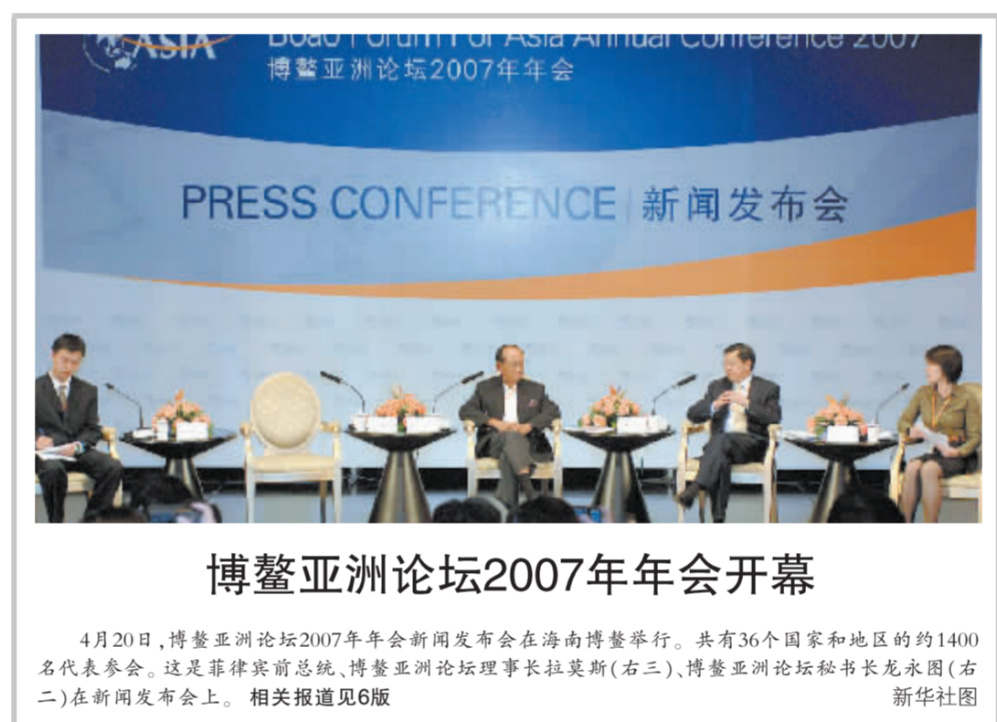
博鳌亚洲论坛2007年年会开幕

人,目前已协调中科招商基金开始运作相关事项,发起设立市场化运作机制的子公司,“现在基金还在争取国家主管部门设立试点的批准,我们也在等待产业基金相关政策出台。”据悉,该基金的投资方向主要面对央企二级、三级企业的改制重组,同时,也要参与地方大型国企的改制重组工作。