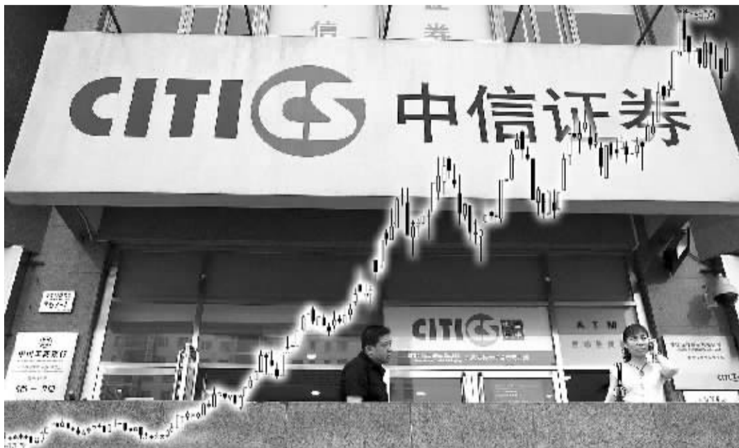
中信证券受到新老基金的一致追捧,一季度内增持2亿股

2007年第一季度的基金季报上周末全部完成披露,在全程详尽报道最新一季基金季报之后,本期基金周刊为读者精心挑选出了一季度末基金投资的四宗“最”,以另一个视角为投资者盘点最新一季基金投资的四大特征。