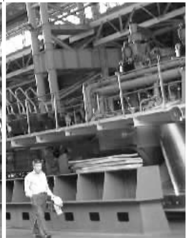
成为“中国船舶工业集团公司”整体上市对象的沪东重机,21家基金花费200亿元“控制”了该公司四分之一的在外流通股