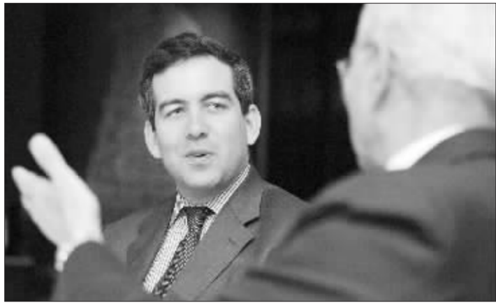
美国商务部助理部长薄希金 资料图

在具体日程方面,美方安排在23日至25日到中国两大城市——北京和南京访问。在此之前,代表团还到访了印度两座城