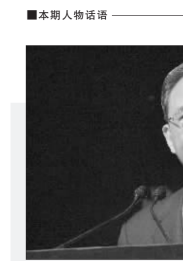
推进钢铁工业增长方式根本转变

曾培炎(国务院副总理)4月27日在出席国务院召开的钢铁工业关停和淘汰落后产能工作会议上发表讲话时强调,要全面落实科学发展观,认真贯彻全国节能减排工作会议电视电话会议部署,把节能减排的任务和措施落到实处。通过关停淘汰钢铁落后产能,大力调整产品结构、企业结构和产业布局,降低能源消耗和污染排放,努力实现钢铁工业增长方式的根本性转变。