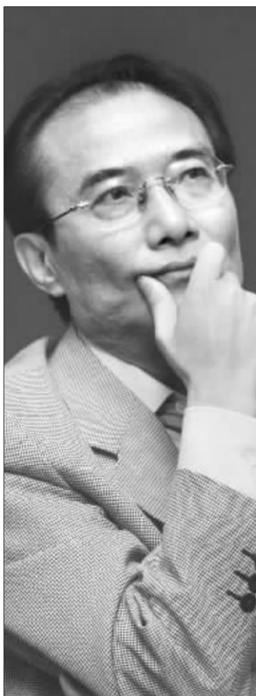
股市的问题让股市自身去调整,投资者也会在行情的涨涨跌跌中提高素质,没有必要在泡沫问题上争论太多。

2006年,中国银行和工商银行上市,农业银行启动股改。海外资金纷纷入股大银行,2001年就出版了《金融控股公司研究》的夏斌,以他对中国金融控股公司历史和现状的熟悉奋力疾呼:引入战略投资者是必要的,但是在一个历史时期,社会金融资源的配置大权不能旁落他人,应该确立金融安全理念。这场争论最终以国务院“国有银行国家要绝对控股”的表态告一段落。