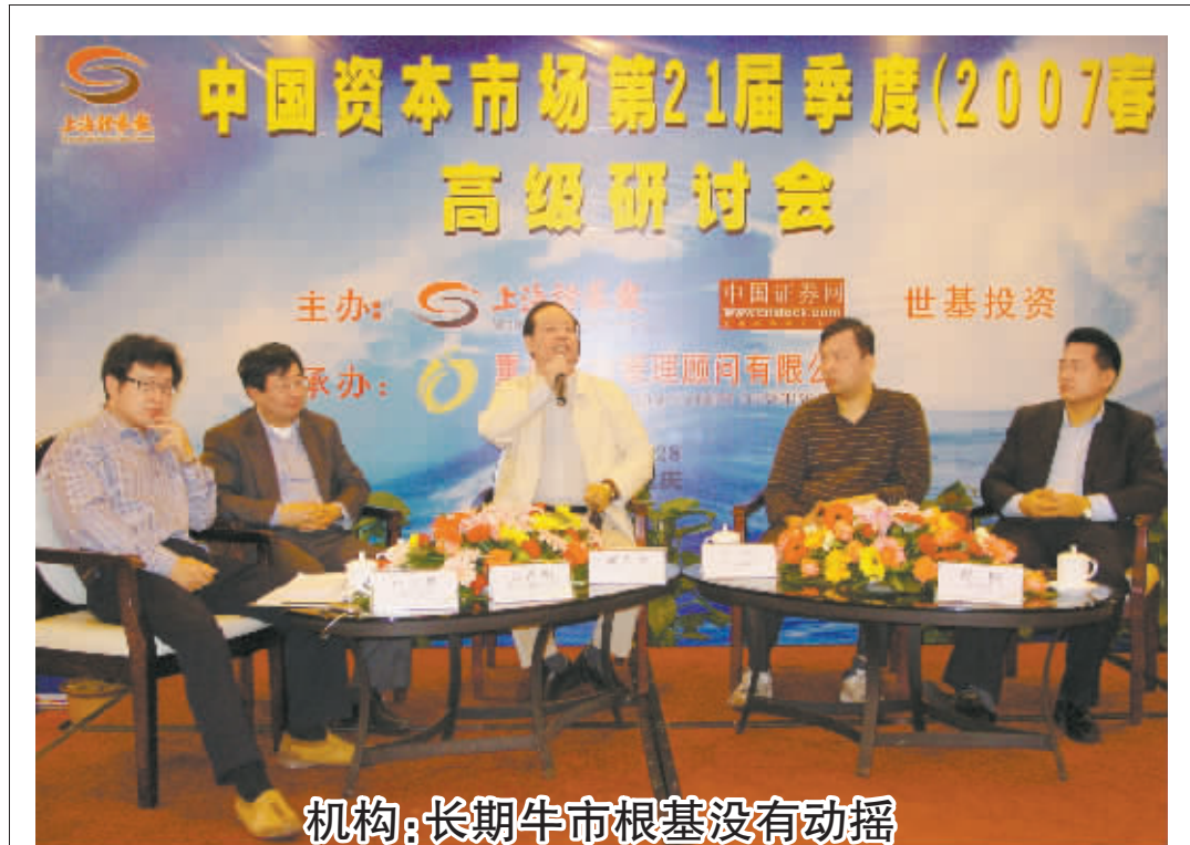
4月28日,本报在重庆召开“中国资本市场第21届季度(2007春)高级研讨会”,来自国内各大证券公司、基金公司、信托公司、投资咨询公司、私募基金的100余位代表普遍认为,二季度市场运行格局未变,长期牛市根基没有动摇,资本市场仍将健康稳定地发展。图为嘉宾们正在发言。 相关报道详见封二 本报记者 姚炯 摄

该负责人表示,针对二级市场出现的信息披露和股价异动密切相关的问题,证监会已建立信息披露与市场监管联动、非现场监管与现场检查、常规检查与立案调查联动的机制。证监会、证券交易所和证监局“三位一体、分工协作”,信息披露监管、市场监管、立案稽查等部门保持监管信息的共享和及时传递,建立多层次的联动机制,实现快速反应。(下转封二)