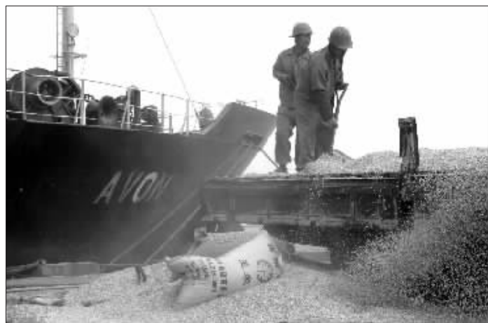
物流瓶颈制约着我国“北粮南运”的格局 资料图