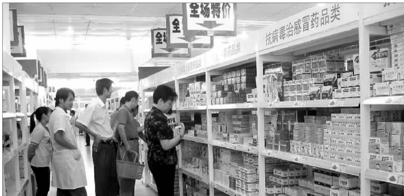
发改委昨日宣布对西药降价50亿元,截止目前,今年药品降价累计已达170亿元 资料图

2001年,我国药品降价为45亿元左右;2004年为至少35亿元;2006年为60多亿