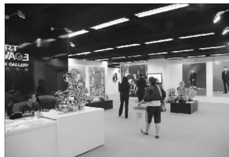
画廊博览会上新时代画廊展位