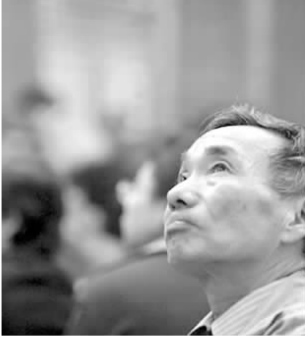
六成投资者不愿在4000点附近购买基金

“这说明目前市场资金确实到了严重过剩的地步,即便只有三成左右的投资者购买基金,也能把基金抢购一空。”一位市场人士感叹。