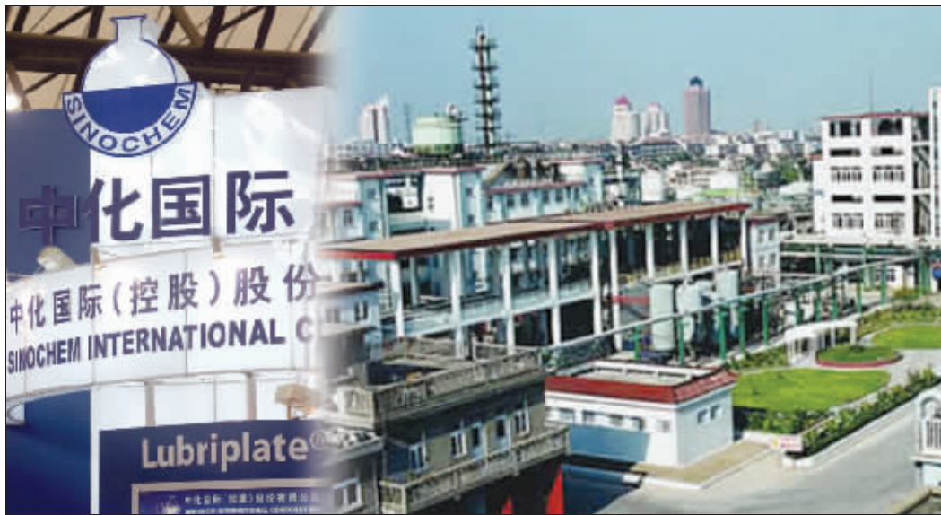
中化国际收购江山股份部分股权后,对江山股份的未来发展大有好处 张大伟制图

若上述事项得以落实,中化国际将成为江山股份名义上的第二大股东。不过,以28%的持股比例,几乎与第一大股东手中的股份同等权重,江山股份将来