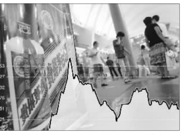
贵州茅台昨表现振幅高、换手率高和成交金额高