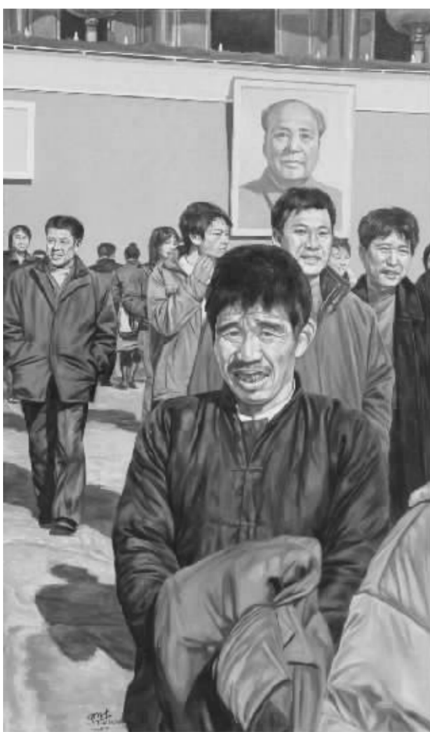
田子仲个人展作品