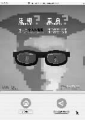
尚一心个人展作品