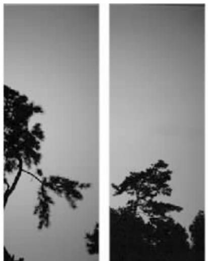
孙红宾摄影展作品